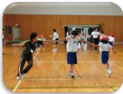
交流及び共同学習