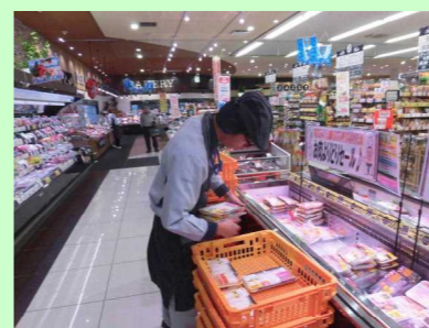
産業現場等における実習