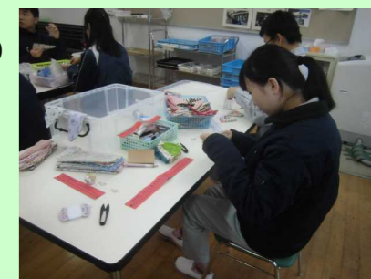
作業学習（ハーブ製品作り）