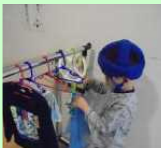
洗濯物を干します