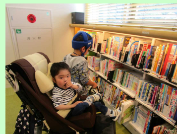
小学部校外学習（図書館）