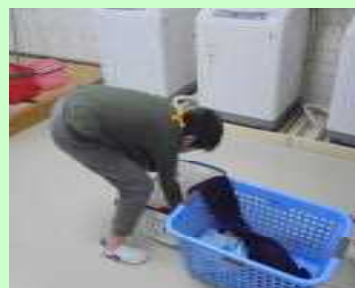
洗濯物を自分のかごに入れる