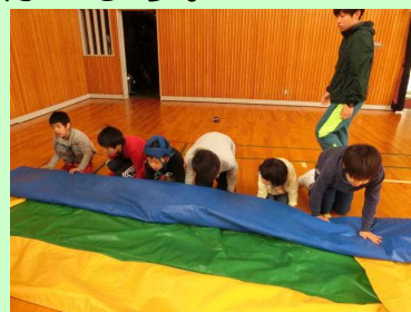
わくわくタイム（片付け）