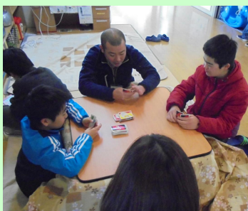
みんなでトランプをします

A 高等部、中学部の先輩と4人一部屋で生活します。洗濯物干し、取り入れも自分でします。規則正しい集団生活をしています。