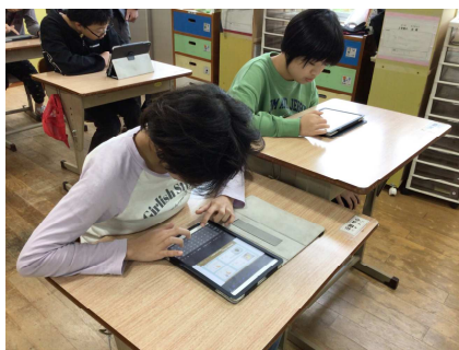
中学部 喫茶店のチラシづくり

高等部では、校外学習、修学旅行や授業で情報検索をしたり、アプリを使って動画を作ったりしています。また、パソコン活用技能向上に向け、県の特別支援学校パソコン検定試験にチャレンジしています。iPadの部とパソコンの部があり、自分の技能に合わせ、受験級を選び、検定試験を受けています。