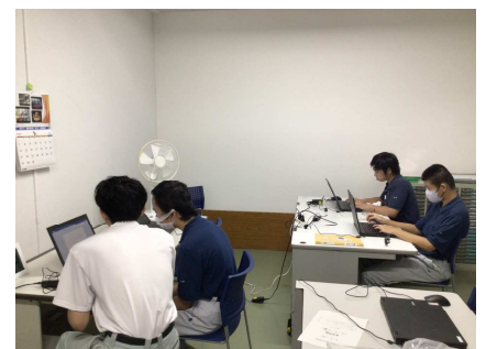
高等部 パソコン検定

どの学部でも操作の仕方をすぐに覚えて、自分から意欲的に学習に取り組むことができています。