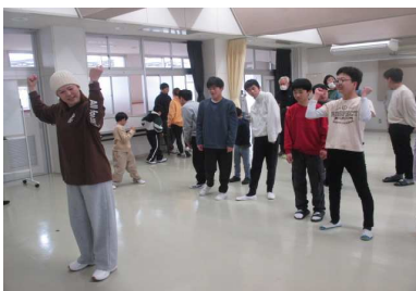
「ダンス」地域連携 (余暇)