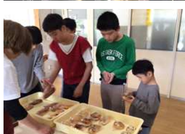
買い物学習 (移動パン屋さん)